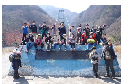
キッズレンジャー