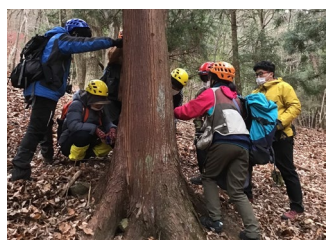
麻布大学調査実習