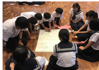
筑波大付属中学校