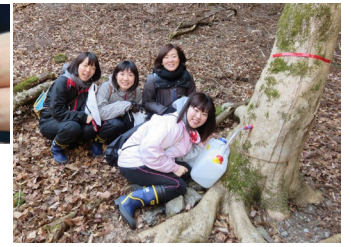
手作りメイプルシロップツアー