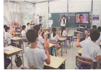
落合小学校オンライン授業