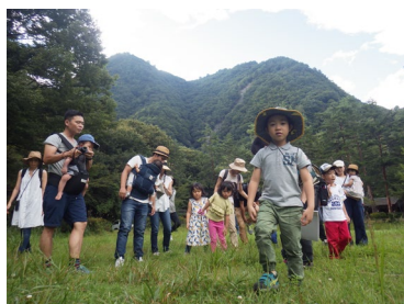
もりもりキッズ早川幼児キャンプ

計3回実施。小学生対象のキャンプ。野外体験を通して自然環境や生物の理解を深める。また科学的思考や協力など生きる力を養う体験も行う。