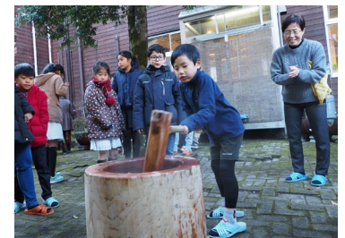
ゆく年くる年プラン