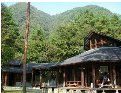
南アルプス邑野鳥公園