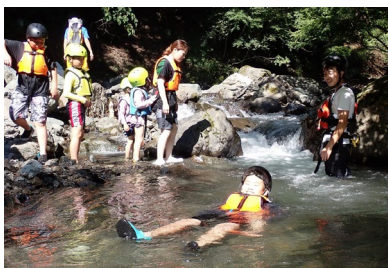
南アルプスの清流で川遊びプラン