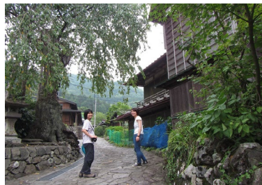
早川ぶらり町歩き