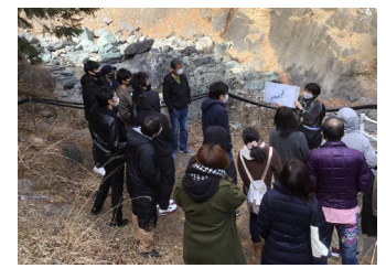
下部ホテル従業員研修