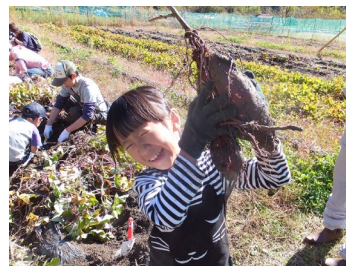
さつまいも掘りプラン