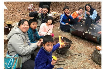
たき火カフェプラン