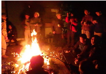
どんど焼きプラン