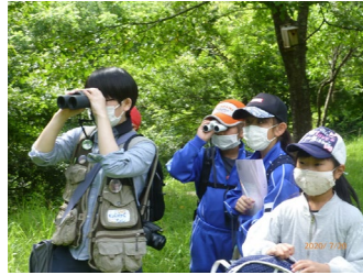
早川町北小学校ビーンズ