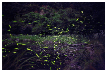
ホタル見ナイトプラン