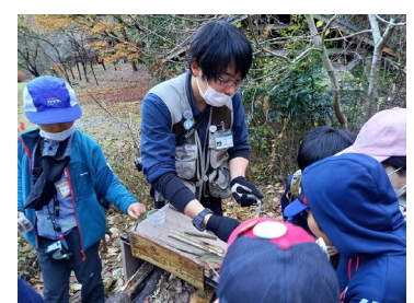
キッズレンジャー